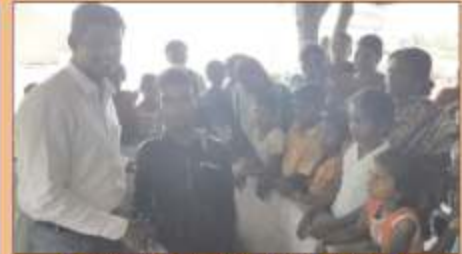
திருவாதவூரில் திருமுழுக்கு பெற்ற வாஸிப சகோதரன்...