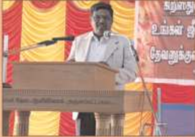
மதுரை, ஒத்தக்கடை கிறிஸ்துவின் சபையில் நடைபெற்ற ஐக்கிய ஆராதனையில், நமது ஆசிரியர் செப்தியளித்த போது...

Owned, Published & Edited by P.C. PHILEMON RAJAH Printed at Thee Classic Printers Madurai-1 Phone 2323819 Registered News Paper No. : TNTAM/2011/42166 Postal Registration No. : TN/MA/67/2015-2017 Posted at Arasaradi HPO on 10th, 11th October 2017