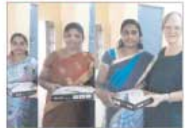
ஆத்தம் ஆதாயம் செய்த மாணவர்களுக்கு நிலைவு பரிசு வழங்கப்பட்டது