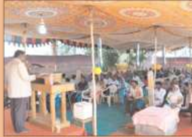
மதுரை, அரசாடி கிறிஸ்துவின் சபையில் நடைபெற்ற பெண்கள் கூட்டத்தில் பங்குபெற்றோர்...