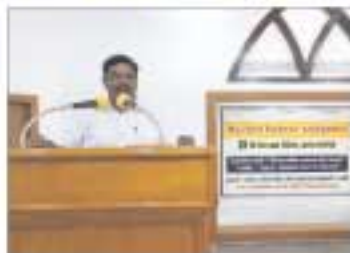
காங்கேயத்தில் நடைபெற்ற வேதாசன சுருத்தலங்கில் நமது ஆசிரியர் செய்திபளித்தபோது...