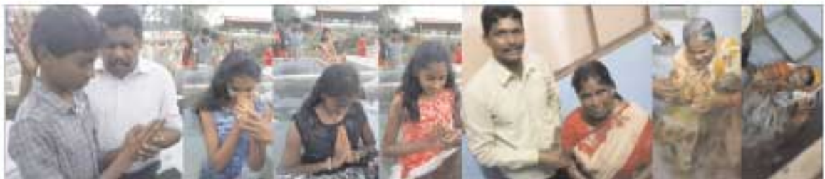
நமது J.C. ஆத்தம் ஆதாயப் பவிர்சீப் பள்ளி மாணவர்களின் முயற்சியினால், திரையுழக்கிசை வசனத்திற்கு கீழ்ப்படிந்தவர்கள்