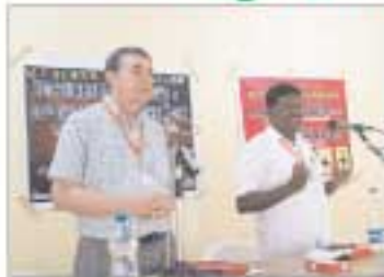
கீக்யாவராவில் நடைபெற்ற வேதாசன சுருத்தல்கள் உரு ஆசிரியர் & சகல சேவரி உடன்

J.C. ஆத்தம் ஆதாயப் பவிர்சீப் பள்ளியின் 10 வது பட்டமளியு நிகழ்ச்சி - கர்நாடக மாநிலம்