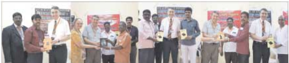
நமது J.C. ஆத்தம் ஆதாயப் பவிர்சீப் பள்ளி சாப்பாக 'தொழுகை' (தமிழ்), 'Holy Spirit' (ஆங்கிலம்), 'வேதாசன சபை' (தமிழ்), 'தேநிலோர்' (கன்னடம், ஆங்கிலம்) ஆகிய புத்தகங்கள் வெளியிடப்பட்டது...