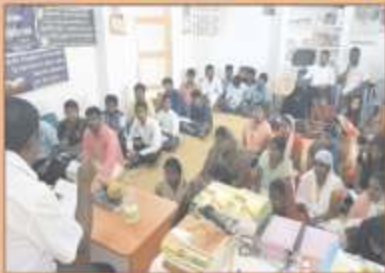
மதுரை திருவாதவூர் கிறிஸ்துவின் சபையில் நடைபெற்ற வாஸிபர் வேதாகம முகாமில், நமது ஆசிரியர் செப்தியளித்த போது...