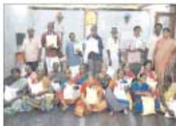
கும்பகோணம் பார்வையற்றோர்க்கு அரிசி வழங்கப்பட்டது...