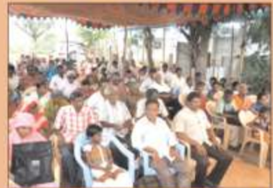
திருவாதவூரில் நடைபெற்ற பார்வைபற்றோர் வேதாகம முகாமில் பங்குபெற்றோர்...