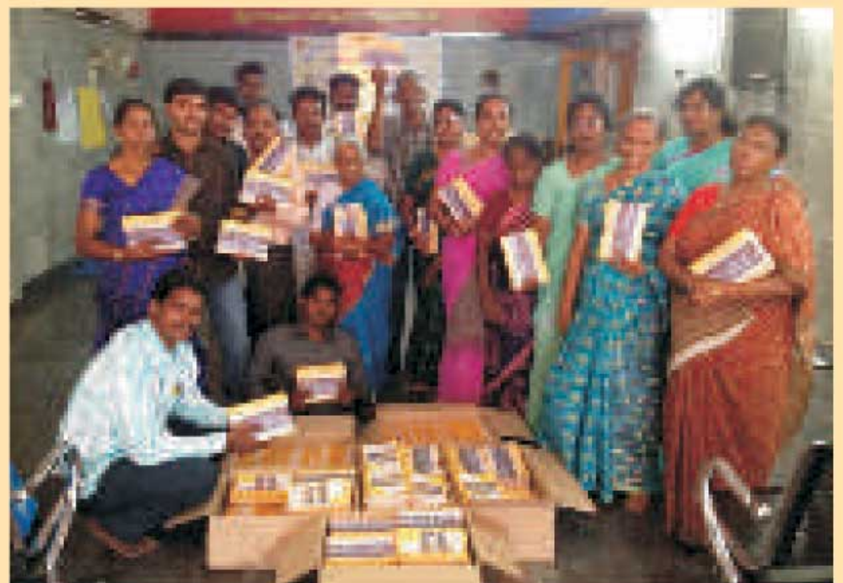
நமது மாத பத்திரிக்கையை தயார் செய்து அனுப்பும் Volunteers