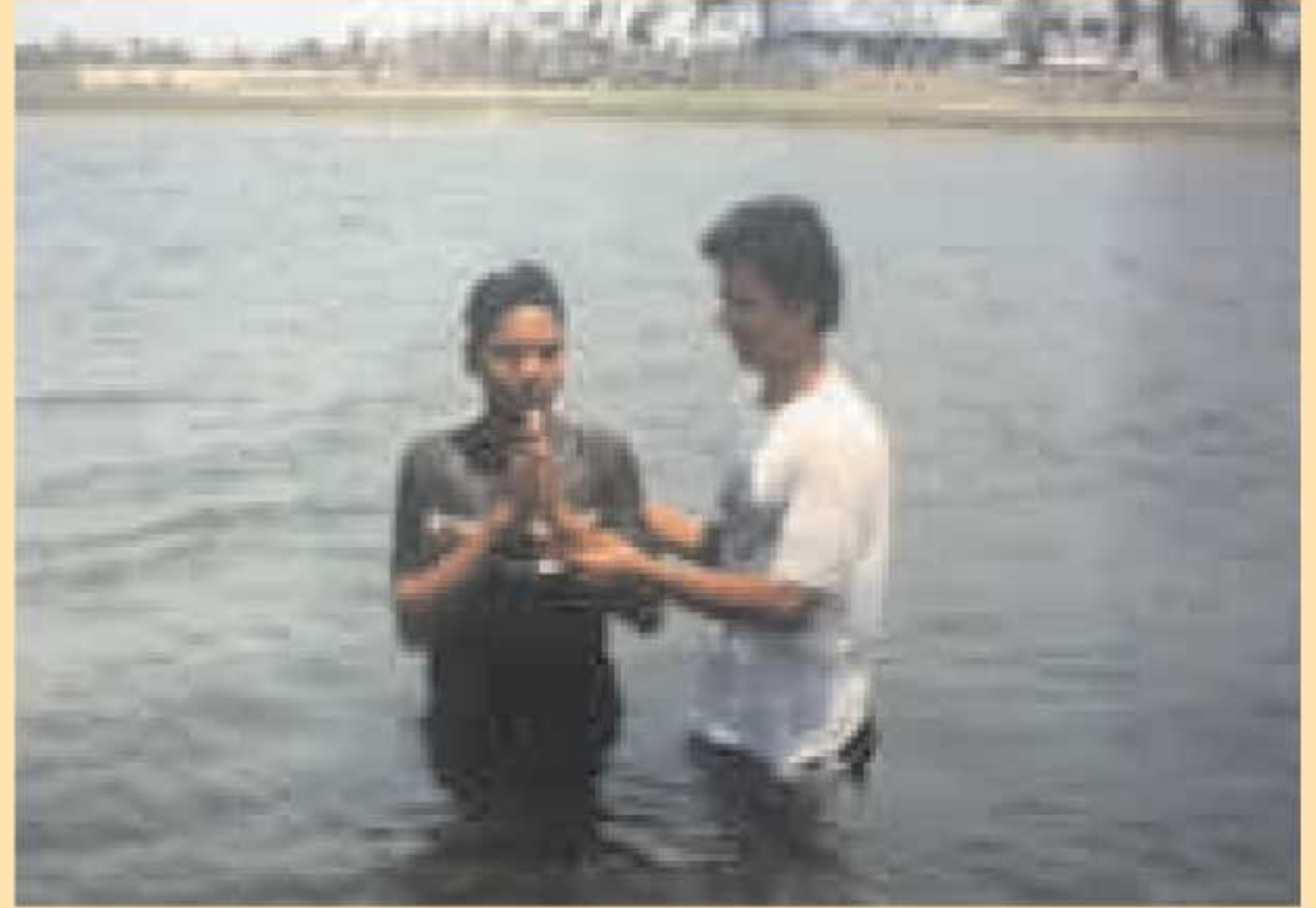
ஒரிசா மாநிலம் கோபால்பூரில் சமீபத்தில் வசனத்திற்கு கீழ்படிந்த வாலிபர்