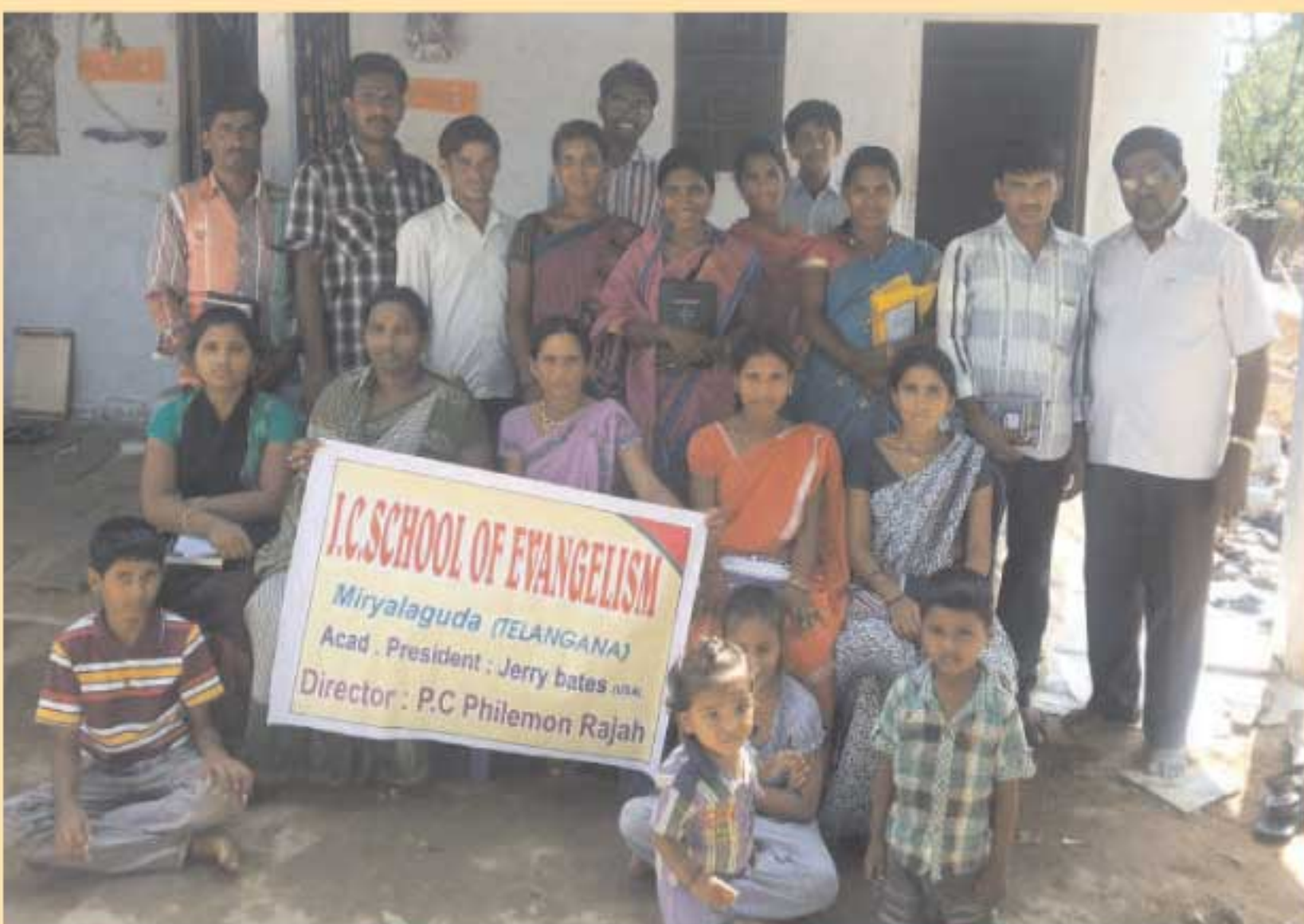
தெலுங்கான மாநிலம் மிரயலகுடாவில் நடைபெறும் ஆத்தம ஆதாய பயிற்சி வகுப்புகள்