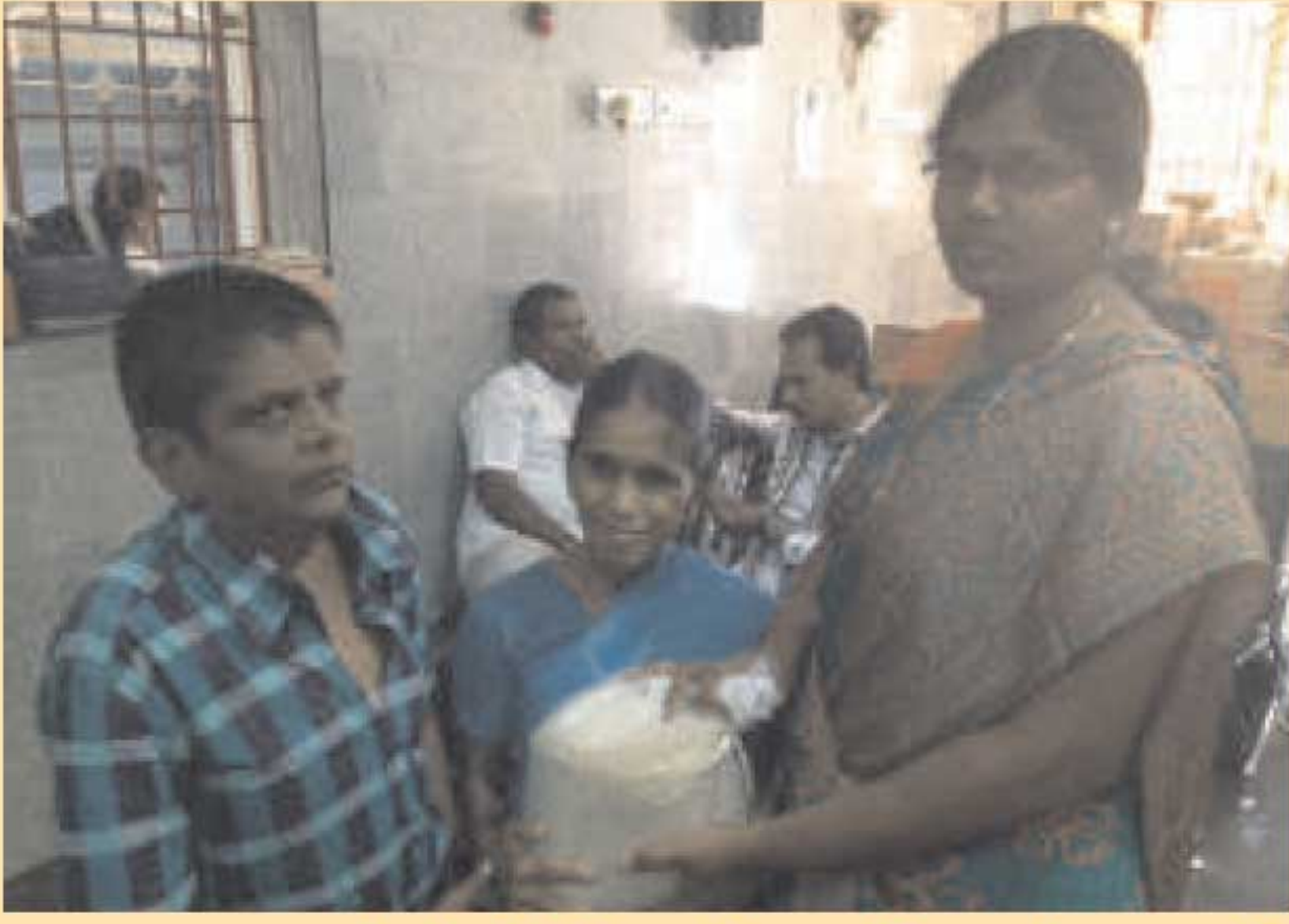
ஏழை மற்றும் திக்கற்ற பார்வையற்றோருக்கு மாதந்தோறும் அரிசியும், கிறிஸ்துவின் வசனத்தை அறிந்துகொள்ள டாக்கிங் பைபிளும் வழங்கப்படுகின்றது.